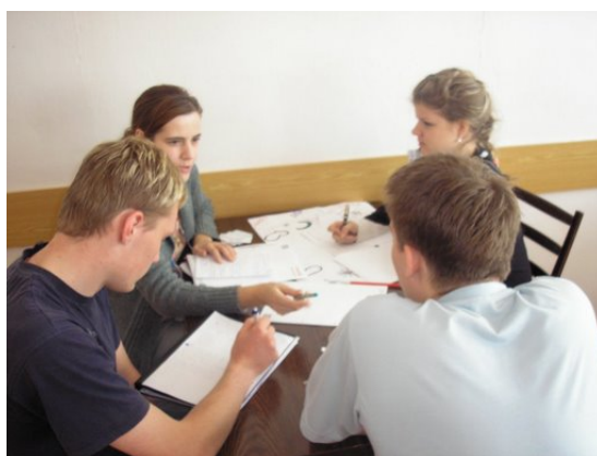
Delegáti počas práce v tíme

V sobotu po rannom úvodnom stretnutí boli pre nových členov na programe simulácie základných aktivít AIESEC od začlenenia sa do organizácie až po ukončenie členstva ukončením vysokej školy. To zahŕňalo napríklad tvorbu tímu, vedenie tímu, nábor členov, tvorba a uskutočnenie projektu, zahraničná odborná stáž, obchodné stretnutie a iné. Cieľom bolo ponúknuť novým členom praktický pohľad na to, čo ich v organizácii čaká. Pre ostatných členov boli tréningy na soft skills ako self management, team management a selling. Po večeri nasledovalo predstavenie svetových problémov, ktorými sa AIESEC zaoberá a veľmi dobre hodnotený tréning na time management. Deň sme opäť ukončili spoločným zhodnotením celého dňa.