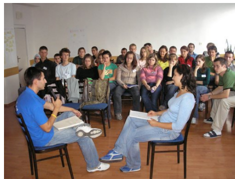
Delegáti počas konferencie

Nasledovalo predstavenie organizácie (história, vízia, ciele), ako aj predstavenie oblastí, ktorými sa zaoberá a možnosťami, ktoré ponúka. Po zaujímavom posedení s bývalými členmi organizácie bolo na programe zhodnotenie celého dňa.