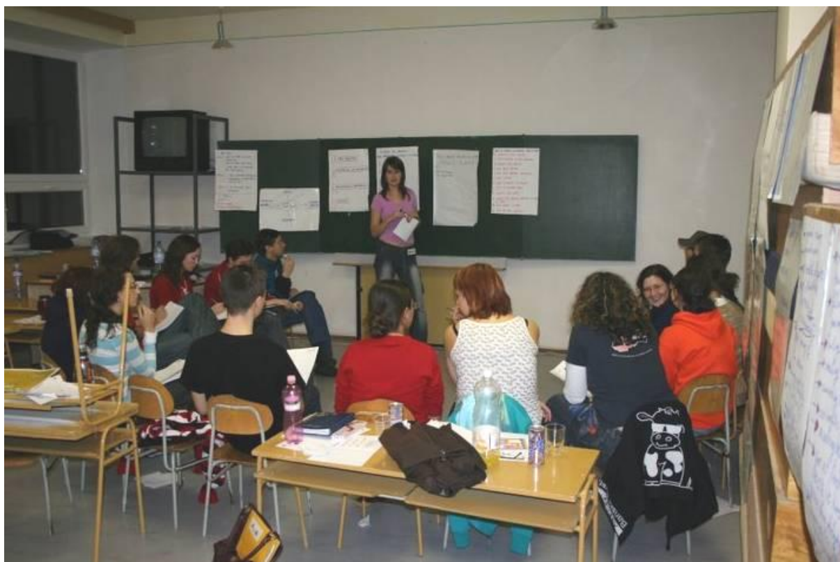
Delegáti TtT počas práce na konferencii