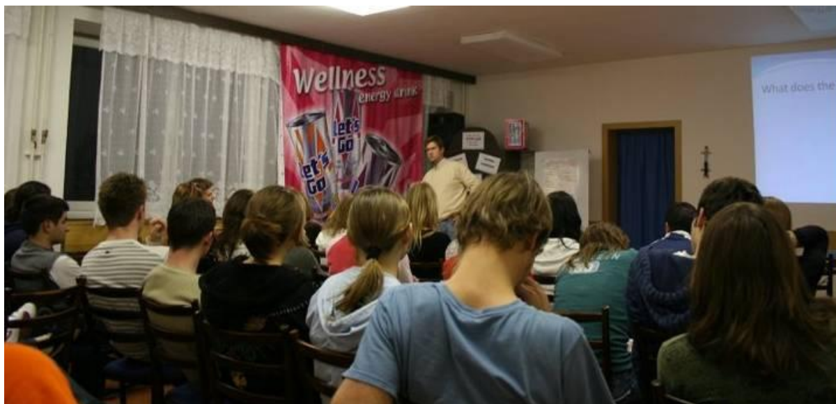
Delegáti OPS počas prednášky na konferencii

V nedeľu boli pre delegátov TtT na programe praktické tréningy, ktoré si sami pripravili a od prezentovali. Nasledovalo zhodnotenie a prijatie rád a odporúčaní od facilitátorov. Pre delegátov OPS nasledovali prednášky o systéme prihlasovania na stáže, ako pracovať s našou internou databázou a o tom čo ich v nasledujúcich dňoch čaká.