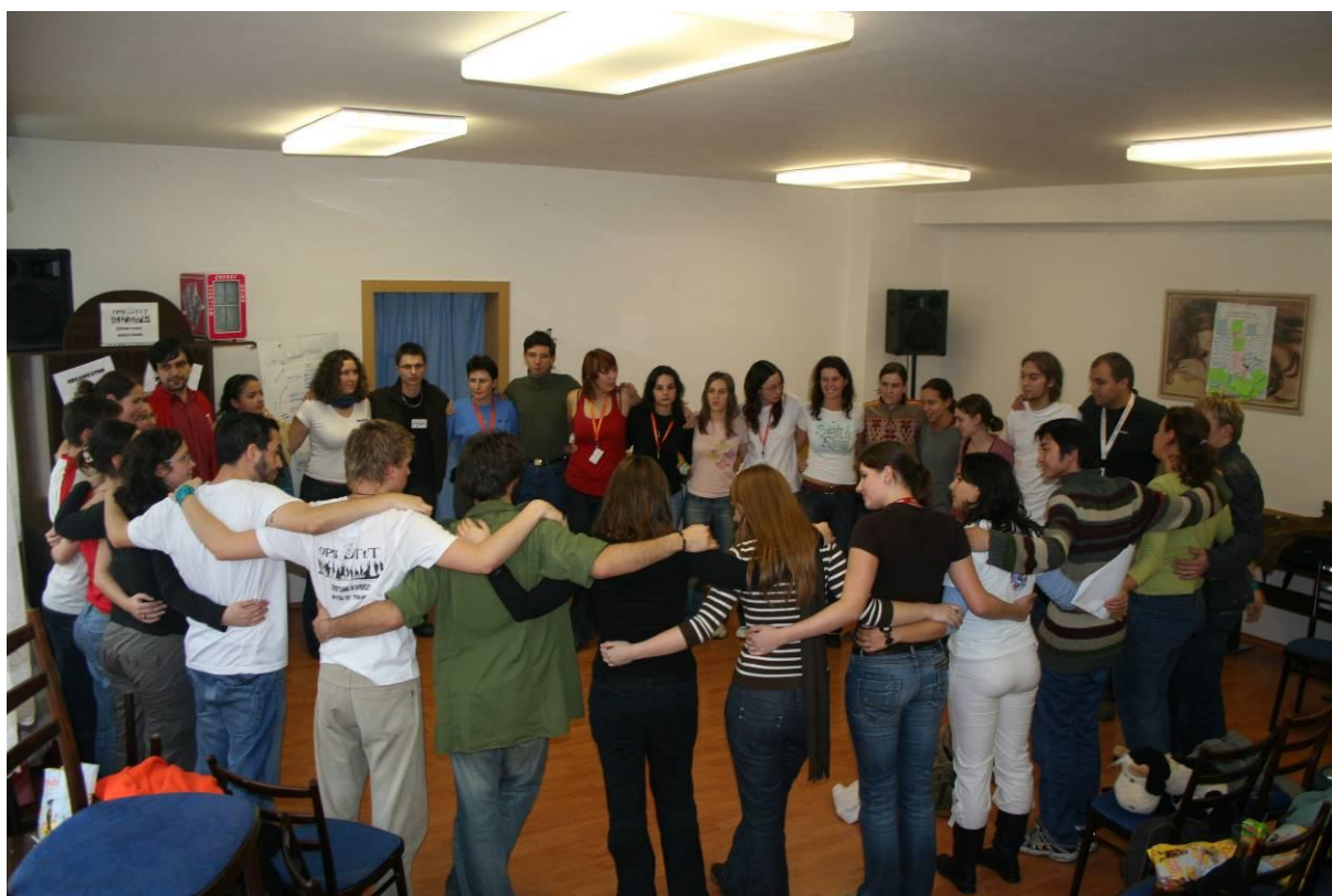
Posledné spoločné zhrnutie cieľov konferencie

Všetky ciele konferencie boli splnené podľa našich očakávaní.