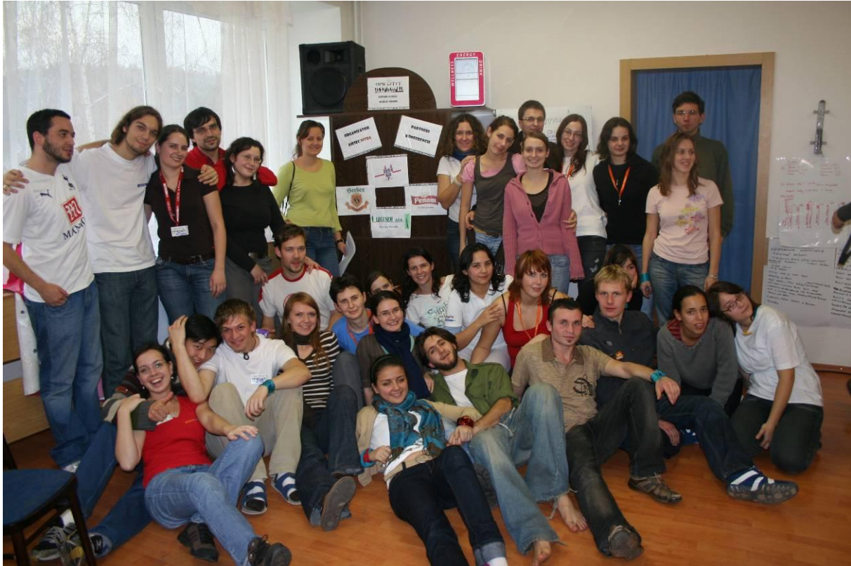
Delegáti OPS & TtT pod logami partnerov konferencie