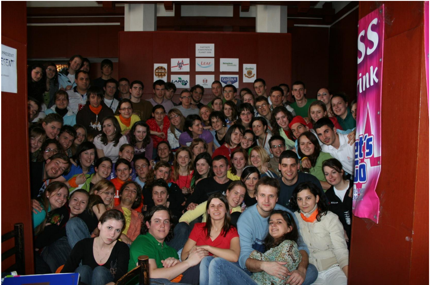
Delegáti pri paneli partnerov konferencie