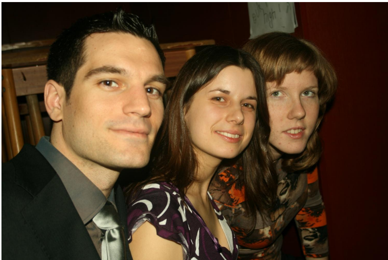
Členovia organizačného tímu počas slávnostného večera